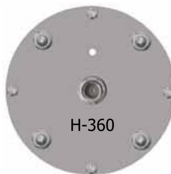
Spodní strana antény