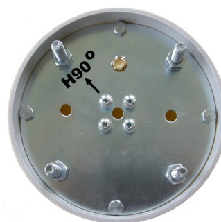
Spodní strana antény