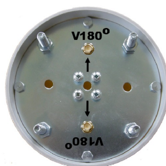
Spodní strana klastru