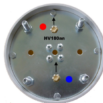
Spodní strana antény