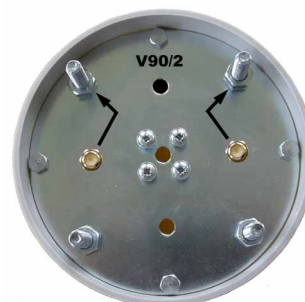
Spodní strana klastru

Zisk: 2x16 dBi Polarizace: vertikální Impedance: 2x50 Ohm Konektor: 2x RPSMA (panelový SMA s reverzní polaritou, volitelně N-female ) Rozměry: průměr 110 x 350 mm Hlavní lalok: 2x 90° (E- rovina@-6dB) ČSV: 1,5 Vert. úhel vyzařování: 13° (V- rovina@-3dB) Pásmo: 5470 - 5725 MHz Výkon: 1 W Hmotnost: 1,9 kg Kryt: PVC-U