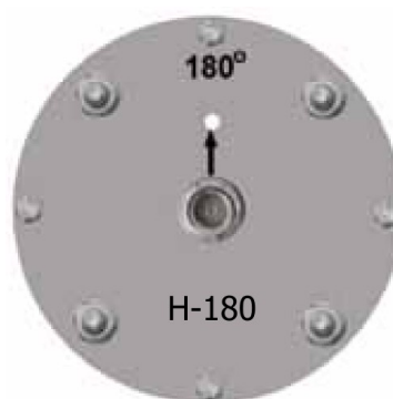
Spodní strana antény